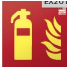
Placa señalización "Extintor"