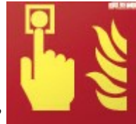
Placa señalización "Pulsadores de Alarma"