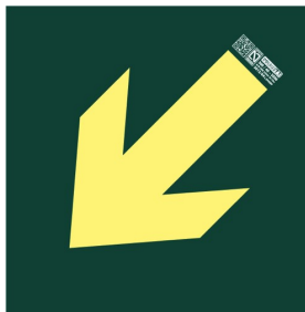
Placa señalización "Bajada Escalera"