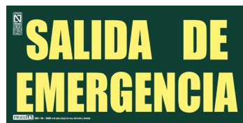
Placa señalización "Salida de Emergencia"