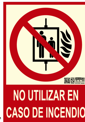
Placa señalización “No Utilizar en caso de Incendio”