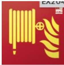
Placa señalización "BIE"