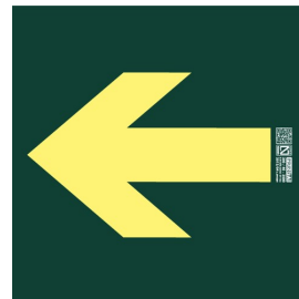
Placa señalización "Indicadora Via de Evacuación"