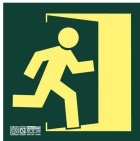
Placa señalización "Salida"