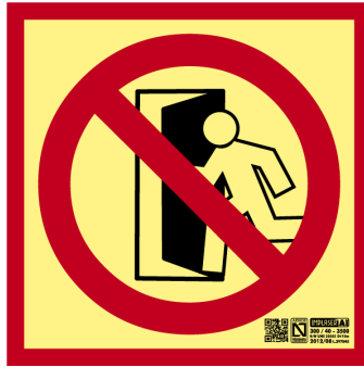
Placa señalización "Sin salida"